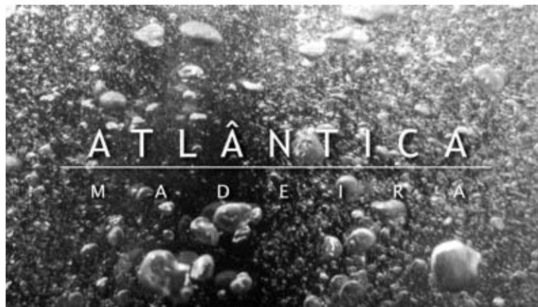
‘Atlântica Madeira’ é uma homenagem ao mar da Região.